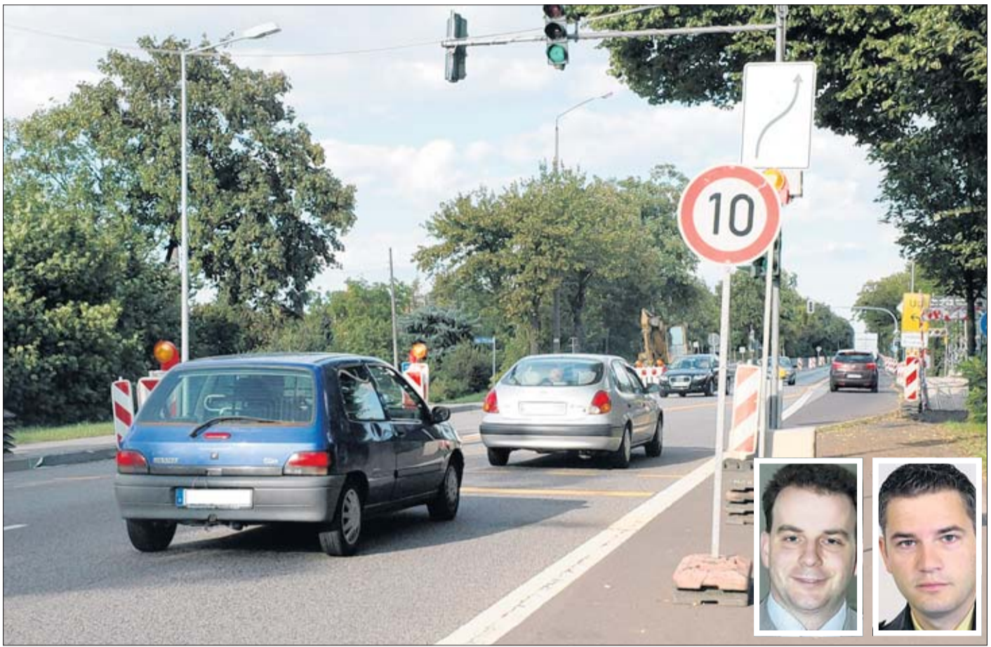
Die stadtauswärts fahrenden Autos werden seit Wochenbeginn über den Seitenstreifen mit einer Geschwindigkeitsbegrenzung auf 10 km/h geführt. Schritttempo ist auf 650 Metern vorgeschrieben und das will die Polizei auch kontrollieren.

Viele Autofahrer sehen sich angesichts der vorgeschriebenen 10 km/h vor einer schwierigen Aufgabe. Einige Tachos begin-