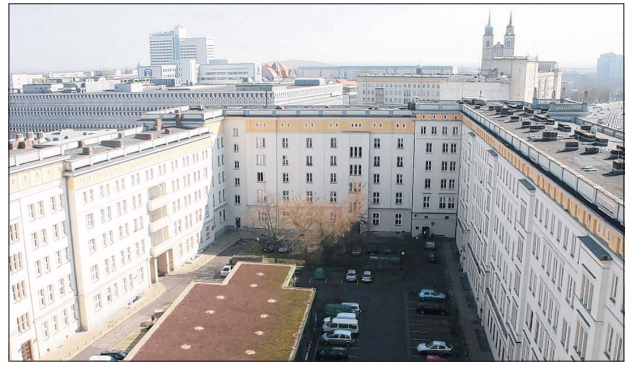
261 Wohnungen gibt es im Wohnkomplex an der Ernst-Reuter-Allee.

blüte im Frühjahr. Rolf Wagner von der Urania erzählt die Geschichte des Parks und weist auf besondere Pflanzen und Tiere hin. Anmeldungen sind möglich unter Telefon 25 50 60.