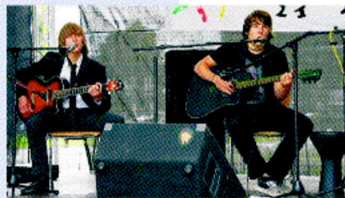
Die Band „The Legal Action“ wird auf dem Brunnenfest mit ihren Gitarren musizieren.

Schöne Wohnungen • Großzügige Grundrisse • Erstklassiger Wohnkomfort