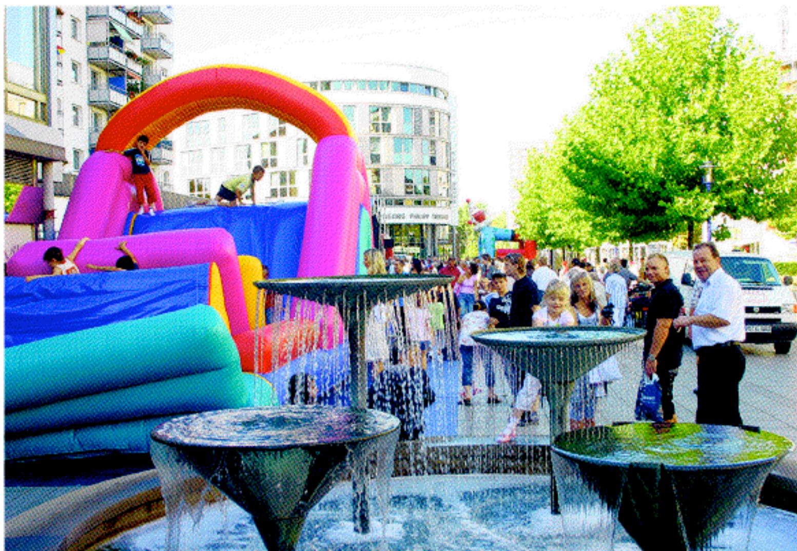
Im letzten Jahr lockte das Brunnenfest bei herrlichem Sonnenschein viele Magdeburgerinnen und Magdeburger auf die Party-meile im Nordabschnitt des Breiten Weges.