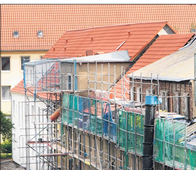
Sanierungsgebiet in der Gartenstadt Westernplan.

technik-Motorgereäte-Helmrich von Elektromechanikermeister Peter Helmrich arbeiten ein Azubi, ein Praktikant und 3 Mitarbeiter. Sie befinden sich in der Straße Zur Viehbörse (ehemals Schlachthofgelände). Ca. 500 Kunden aus Sachsen-Anhalt lassen ihre Bohr-, Kernbohr-, Garten- und Reinigungstechnik hier aufarbeiten.