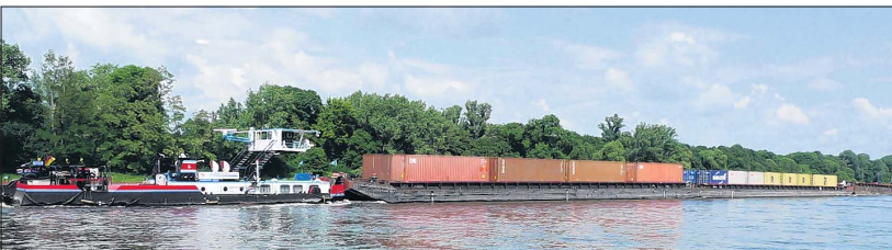
Container-Transport auf der Elbe.

Magdeburg (ka). Schiffsverkehr im Aufwind: Trotz Krise und des deutschlandweiten Rückgangs des Transportaufkommens in der Binnenschiffahrt steigen die Transportzahlen auf der Elbe. Das gab die in Magdeburg ansässige Wasser- und Schifffahrtsdirektion Ost bekannt.