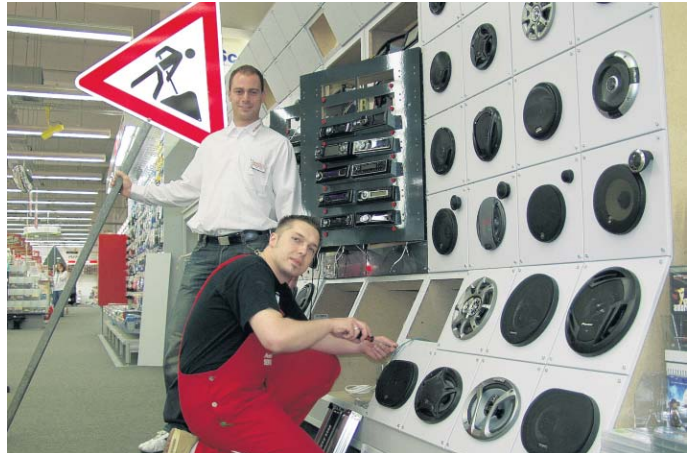
Derzeit ist der Media Markt im Bördepark eine Baustelle. Hier wird die Car-HiFi-Abteilung auf Vordermann gebracht. Trotz Umbauten ist der Markt aber weiterhin geöffnet.