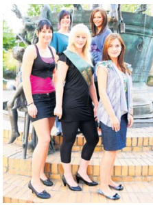
Die amtierende Weinkönigin gibt ihr Zepter ab.

(smü). Eine ehrenwerte Repräsentantin des Weines, die neue Magdeburger Weinkönigin, wird am 4. September in der Leiterstraße gesucht. Im Rahmen des traditionellen Weinfestes von 15 bis 23 Uhr treten die Anwärterinnen in verschiedenen „Teildisziplinen“ zum Wettstreit um die Krone an. Die Gewinnerin soll ein Jahr lang den Wein in der Region repräsentieren. Der Eintritt zum Fest ist frei. Ausnahmsweise wird es einmal nicht nur das Wasser sein, das in der Leiterstraße munter sprudelt. Auch der edle Rebensaft, der am 4. September rund um den Teufelsbrunnen ausgiebig gefeiert wird, soll in Strömen fließen. Mit einem unterhaltsamen Programm locken die ansässigen Händler in Zusammenarbeit mit der Wobau Magdeburg zum geselligen Beisammensein. Bereits ab 15 Uhr heizt Moderator und Sänger Friedo Berg die