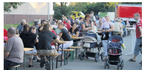
Stimmung kommt auf beim Fest der Freiwilligen Feuerwehr.

stellt und entsprechendes Arbeitsmaterial angeschafft. All diese Vorkommnisse, Gesetze und Feuerverordnungen tragen dazu bei, dass am 13. Juli anno 1894 die Freiwillige Feuerwehr Rothensee gegründet wird. Die Anfangsstärke soll 16 Burschen betragen haben. Summa summarum ergibt das stolze 115 Jahre des Bestehens, die mit einem großen Fest gefeiert werden sollen.