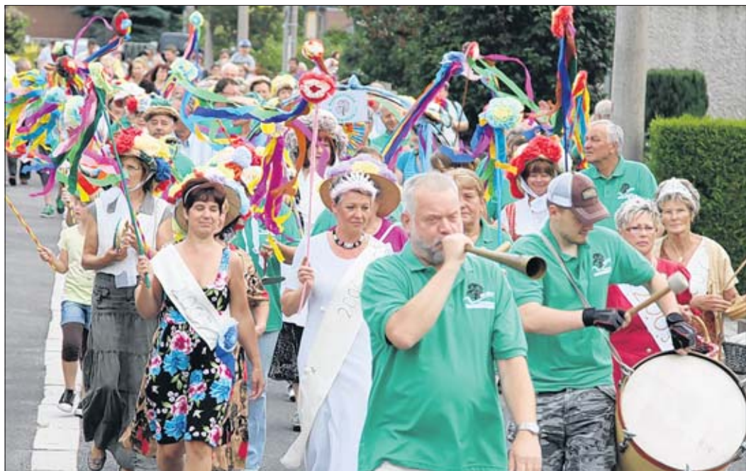
Mit einem stimmungsvollen Festumzug begannen gestern die Bewohner der Gartenstadt Eichenweiler ihr großes Festwochenende.

Festumzug läutet am Abend Party in Eichenweiler ein