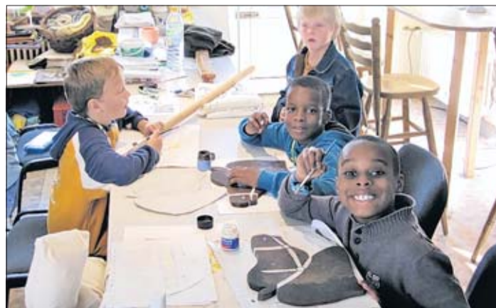
Hier werden die Steckenpferde für das Ritterfest „frisirt“.

oder eine hübsche Perlen- oder Lederkette basteln. Größere Kinder üben sich derweil im Federschreiben oder der Seifenherstellung. Für das leibliche Wohl gibt es Braten vom Spieß, selbst gebackenes Brot und frische Butter vom „Marktstand“. Zum Abend findet das Rittertreiben mit einer mittelalterlichen Feuershow seinen Ausklang. Beginn ist um 14 Uhr auf dem KJH-Gelände, Silberschlagstraße 23.