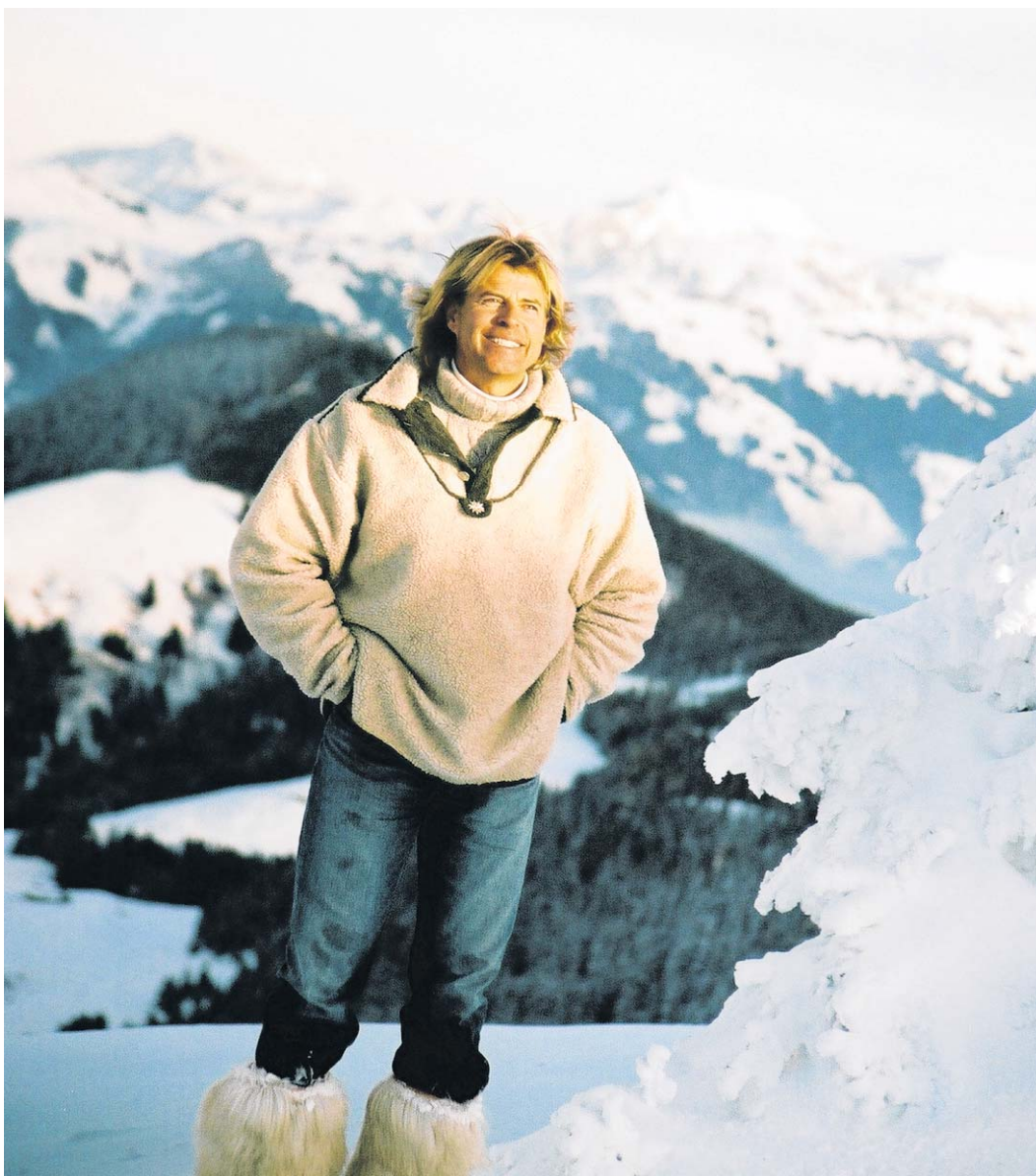
Der Sänger Hansi Hinterseer und seine Band, das Tiroler Echo, sind am 4. März mit einem Konzert in der Getec-Arena.

Wer Hansi Hinterseer live in Magdeburg erleben möchte, bekommt die Tickets dafür an allen bekannten Vorverkaufsstellen