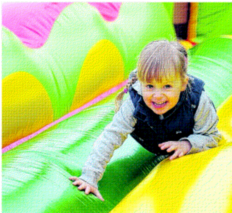
Die Wobau lädt ins Hüpfburgenparadies vom 11. bis 19. Juli im Elbuenpark Magdeburg.

Der Eintritt zum Ferienspaß kostet vier Euro. Der Parkeintritt ist inklusive. Erwachsene zahlen nur den Parkeintritt von drei Euro. Der Wobau-Ferienticket ist täglich von 10 bis 18 Uhr geöffnet.