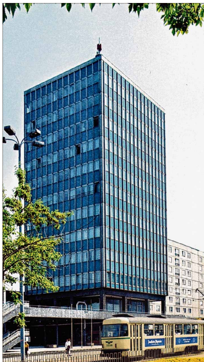
Haus der Lehrer (HdL) in den 1980er Jahren, hier noch recht ansehnlich, nach 1990 aber leergezogen und sanierungsbedürftig.

Heute ist er eines der modernsten Wohn- und Geschäftshäuser in Magdeburg, ein „Leucht-Turm“ für die Stadt an der Elbe. Und das in jeder Hinsicht.