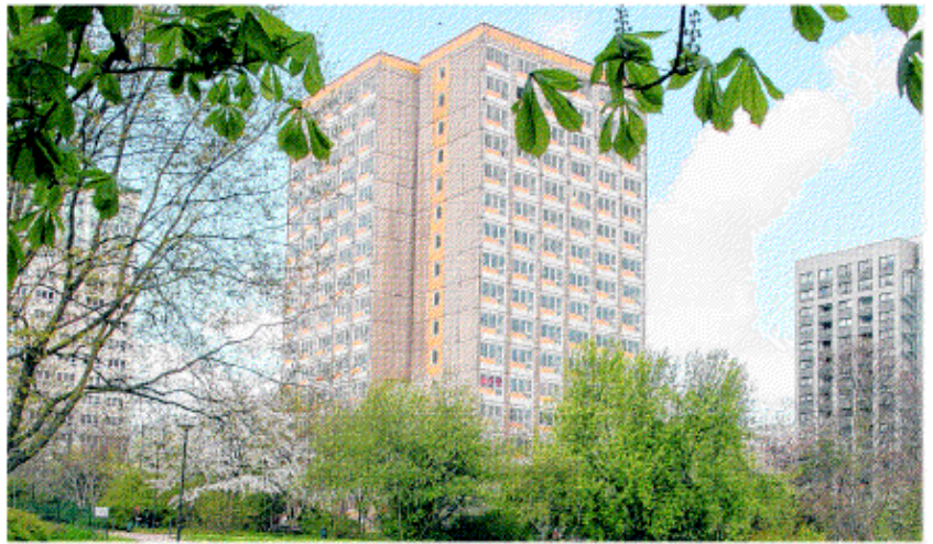
Der 16-Geschosser Am Seeufer 10 wird Mitte Mai entkernt und soll anschließend aus dem Stadtbild verschwinden.

sichtigung des Rundweges am Neustädter See eingeladen. Planetarium und Sternwarte in der Grundschule Kannenstieg können ab 13 Uhr unter die Lupe genommen werden, die Kita Neustädter See öffnet um 15 Uhr ihre Türen und um 16 Uhr gewährt die Schwimmhalle Nord einen Blick hinter die Kulissen. Das Stadtteilmodell Neustädter See wird zum Abschluss ab 17.30 Uhr in der „Oase“ präsentiert.