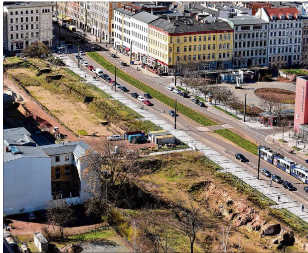
Das Foto zeigt die Baugrube im Südabschnitt des Breiten Weges. Dort wird bis 2020 das neue Magdeburger „Domviertel“ gebaut.

Damit wird der Breite Weg an dieser Stelle dann sein Erscheinungsbild komplett verändern: moderne Architektur, die wieder bis an die Straßenflucht des Breiten Weges heranreicht, so wie es vor dem verheerenden Bombenangriff am 16. Januar 1945 ausgesehen hatte. Die kompletten Untergeschosse der Gebäude werden Gewerberäume für Geschäfte, Restaurants und Cafés bekommen. Damit soll das urbane Leben