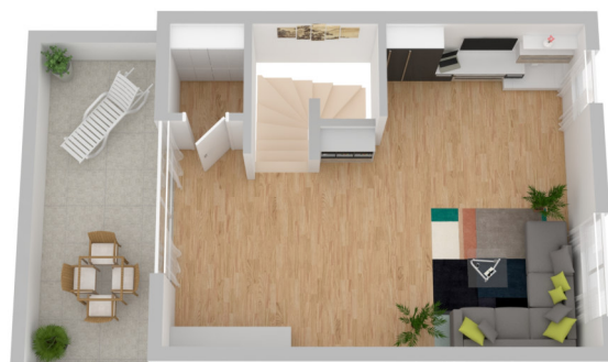
Grundriss 2. Obergeschoss