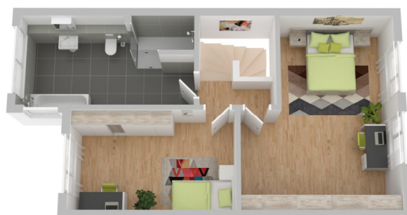
Grundriss 1. Obergeschoss