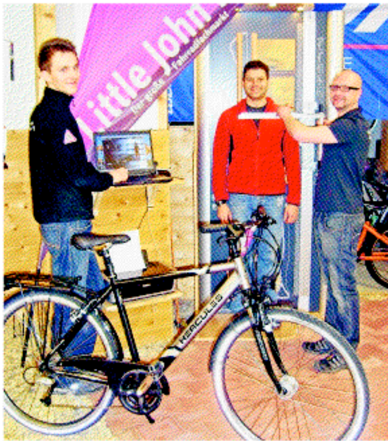
Mit dem BodyScanning werden die Daten für die optimalen Fahrradeinstellungen ermittelt.

Damit auch Sitzbeschwerden keine Chance haben, unterstützt das „Popometer“ bei der Auswahl des richtigen Sattels. Es hilft, den korrekten Abstand der Sitzknochen zu messen. In Kombination mit der gewünschten Sitzposition ermittelt der Verkäufer die optimale Sattelbreite bzw. das passende SQ-lab-Sattelmodell. Übrigens: Für