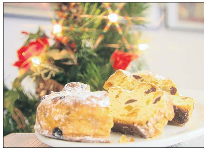
Auf dem Sudenburger Weihnachtsmarkt wird am Sonntag, 6. Dezember, der leckerste Stollen des Magdeburger Südens gesucht.

Das bekannte Weihnachtsgebäck aus schwerem Hefeteig soll vor der Ambrosiuskirche