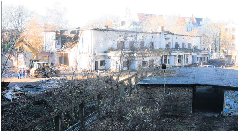
Am gestrigen Mittwoch begann der Abriss des einsturzgefährdeten Maxim-Gorki-Saals des früheren Messgerätewerkes „Erich Weinert“ an der Schönebecker Straße...