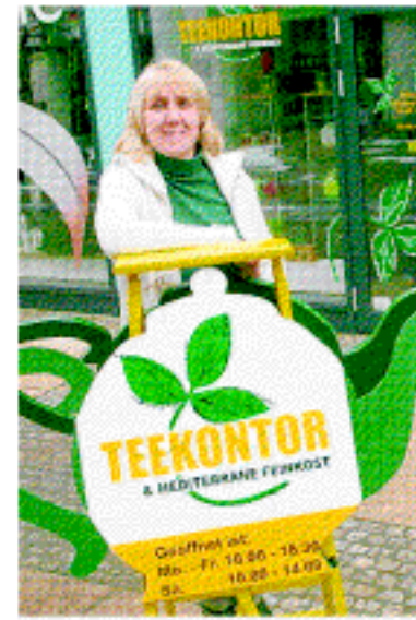
Händler wetteifern am 20. März um den Preis für die am schönsten dekorierte Leiter.

Magdeburg (pi). Die Aufregung der Händler in der Leiterstraße ist groß. Denn ein Fest steht bevor, das dem Namen der traditionellen Einkaufsstraße alle Ehre machen soll. Am 20. März von 13 bis 18 Uhr wird das Leiterstraßenfest ausgerichtet. Für die Feierlichkeiten haben sich die Gewerbetreibenden dort etwas einfallen lassen. Aus alten Holz-Leitern bastelten sie in den vergangenen Wochen farbenfrohe Botschafter für ihre Straße. Die am schönsten dekorierte Leiter soll nun im Rahmen des Festes gekürt werden. Der Eintritt ist frei.