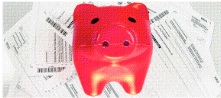
Viele können mit der Steuererklärung zu viel gezahltes Geld zurückbekommen - noch ist es für die meisten aber zu früh zum Ausfüllen der Papiere.

Das gilt auch für Rentner, die nur nur niedrige oder keine Kapitalerträge hatten. Auch sie brauchen die Jahressteuerbescheinigung der Banken nicht und können schon jetzt mit der Steuererklärung loslegen.