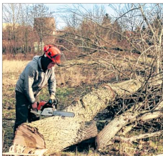
Zur Vorbereitung der Erschließung des Gebietes des Düppler Grundes sind Baumfällarbeiten notwendig.