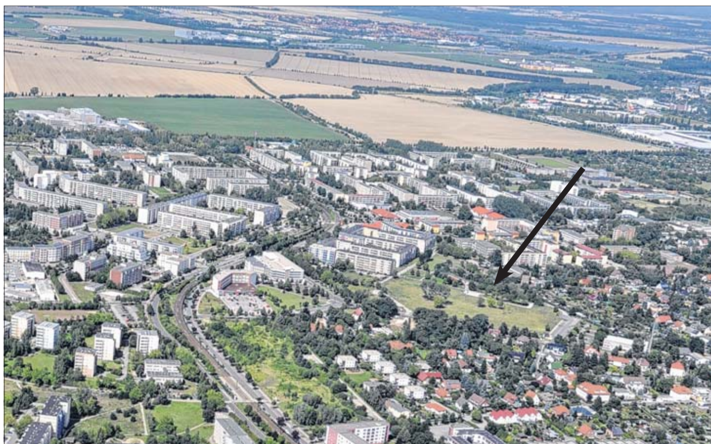
Das Luftbild zeigt den Düppler Grund in Neu-Olvenstedt.

Cracau (mrö) • Die Narren sind los – auch im Osten der Stadt. Mit viel Tanz und Klamauk regnet es heute Konfetti und Luftschlangen im offenen Kindertreff „Happy Station“, Am Charlottentor 31. Ab 15 Uhr gibt es dort für Kinder, ob einzeln oder in Familie, lustige Spiele, die auf keiner Faschingsfeier fehlen dürfen. Partyhits für Klein und Groß sorgen für passende Karnevalsstimmung. Mit einer Runde Musik und Tanz und „den Händen zum Himmel“ findet der Kinderfasching um 18 Uhr seinen Ausklang.