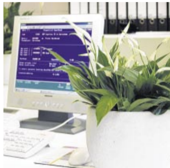
Pflanzen lassen dicke Luft im Büro verschwinden.

(mag/smü). Pflanzen helfen gegen dicke Luft im Büro: Die Madagaskarpalme beispielsweise eignet sich gut, denn sie produziert viel Sauerstoff. Wie die Initiative „Plants for People“ empfiehlt, sollte mindestens eine mittelgroße Pflanze pro Mitarbeiter oder pro zwölf Quadratmeter Bürofläche eingeplant werden. Grau in Grau war also gestern. Büroangestellte sollten sich eine kleine grüne Insel gönnen. Nur das Gießen nicht vergessen!